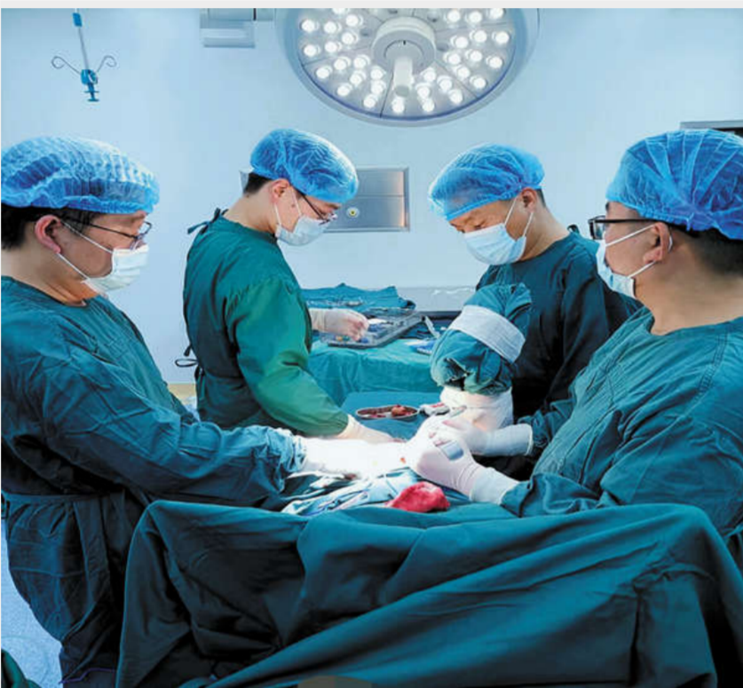
近日,县人民医院医共体夹河分院外科分别为2位超高龄患者顺利实施手术治疗,患者术后顺利康复,赢得了患者及家属的赞许。 两例高龄手术的开展,意味着夹河分院在高龄患者的围术期精细化管理、术前风险评估、麻醉风险评估,术中精准处理,术后护理处置已迈上新的高度。在县人民医院医共体总院的大力支持下夹河分院业务能力将会不断提高。基层振兴道阻且长,溯游从之潮平岸阔。(普外一科 何威)

复发肿瘤已不能切除,遂决定为患者实施永久性结肠造口术。在充分准备后手术成功实施,术后患者腹痛、腹胀症状明显缓解,已恢复正常饮食,腹部伤口及造瘘口恢复良好,生活质量得到了改善,患者及家属对手术效果非常满意。 李先锋表示,自肿瘤专业并入普外二科后,科室已收治多名肿瘤患者,总体治疗效果较满意,此次手术的成功,为科室肿瘤治疗方面积累了宝贵的经验,普外二科将不断地提高医疗服务质量,更好的服务于广大患者。(普外二科 田池涛)