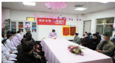
关爱女性健康知识讲座